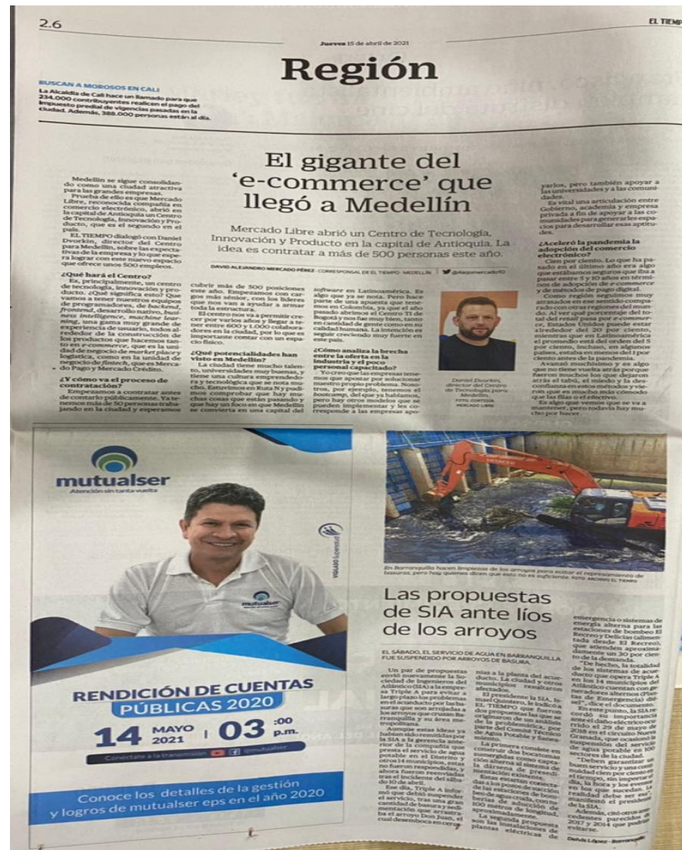
Imagen 5. Publicación en periódico El Tiempo.