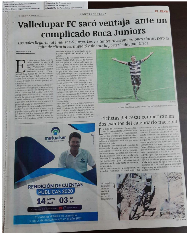
Imagen 6. Publicación en periódico El Pilón.